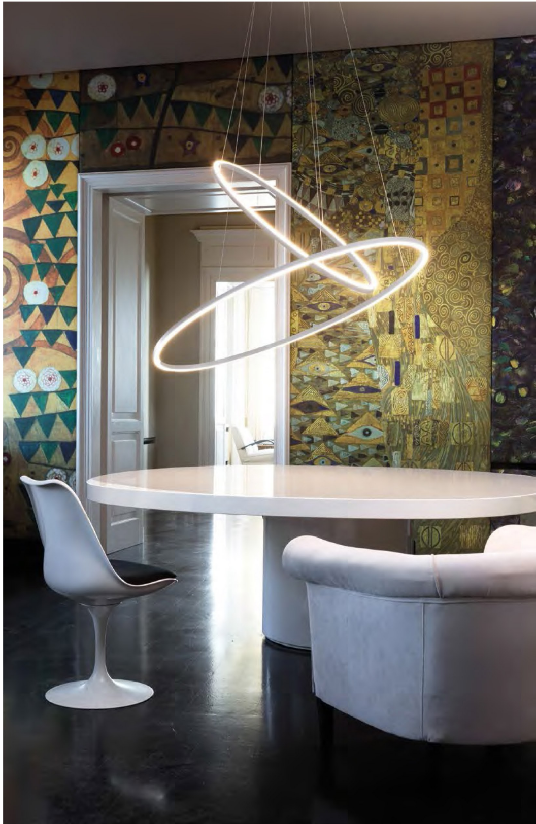
Ellisse Double white