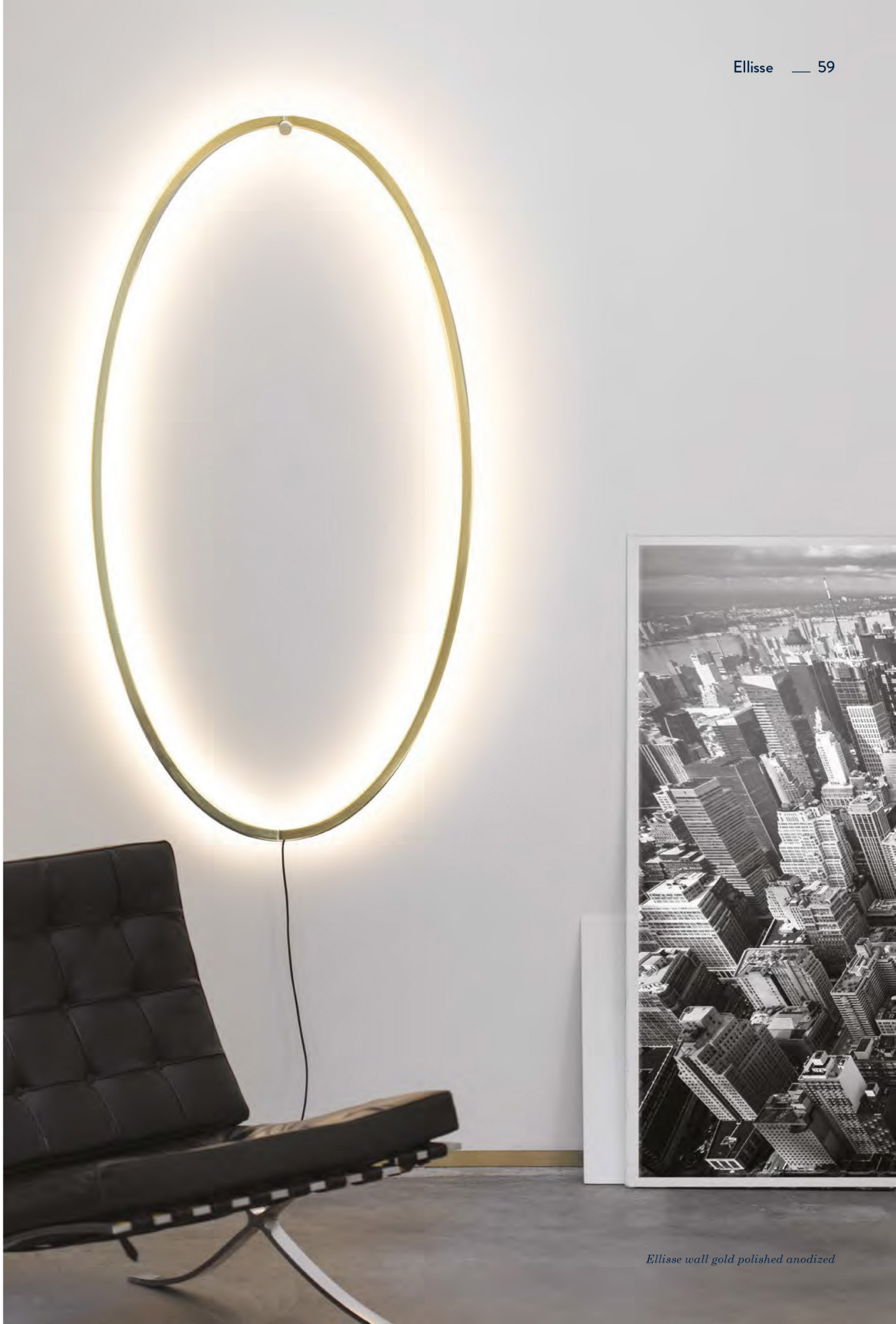
Ellisse wall gold polished anodized