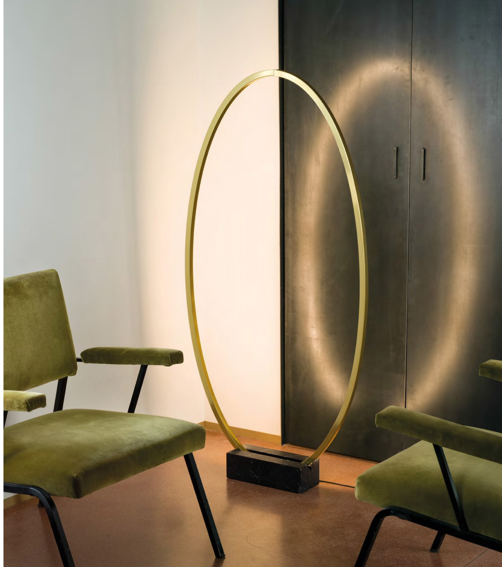
Ellisse floor gold polished anodized and black marble base