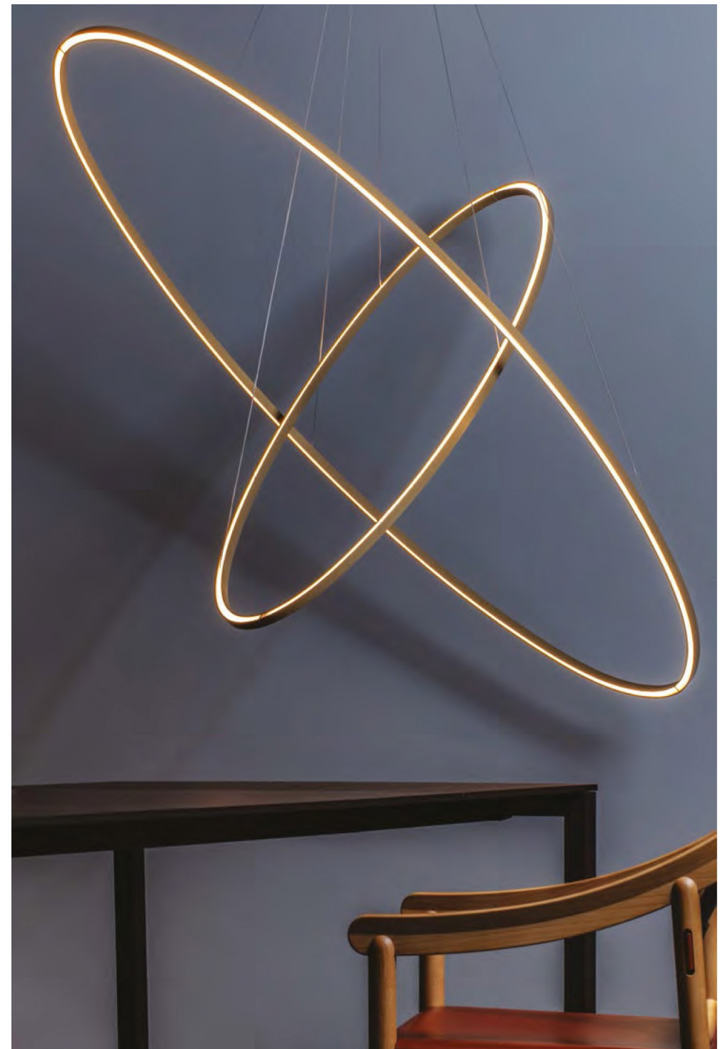
Ellisse Double Mega, gold painted