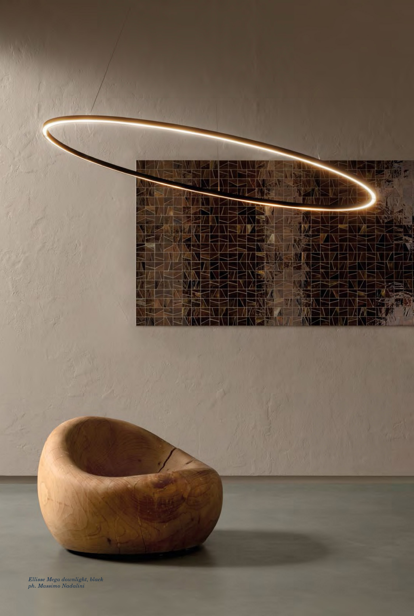
Ellisse Mega downlight, black